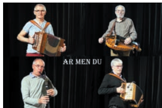
AR MEN DU,

Venez danser avec des groupes locaux sur des airs de nos terroirs et d'ailleurs.